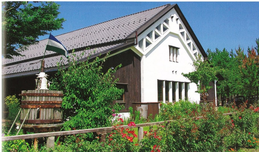
豊かな自然に囲まれて立つワイナリーの醸造棟

丹精込めて育てたブドウから造られるこだわりのワイン。滞在して作り手の思いに触れ、ゆっくりワインを味わえる、泊まれるワイナリーをご紹介します。