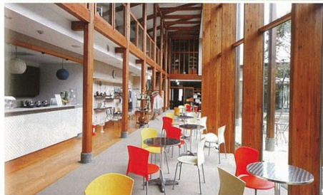
手作ドリンクが楽しめる「カーブドッチ ヴィネスバ」のドリンクバー